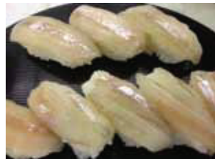
鶴川ししゃも寿司 10月に漁解禁になるししゃもをむかわならではの食べ方のししゃも寿司でお召し上がりいただけます。