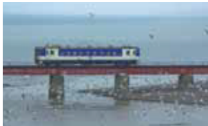
JR日高線乗車体験 太平洋の美しい海を眺める単線日高本線に乗車体験。※自由席の為、お立ちいただく場合がございます。(約25分)