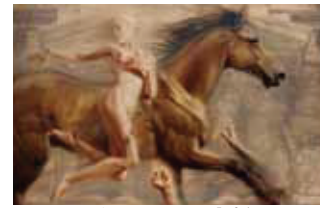
新冠 ディマシオ美術館 人気幻想画家「ジェラルド・ディマシオ」の作品を展示する廃校を利用した美術館で、縦9m、横27mの世界最大の油彩画は、圧巻です。