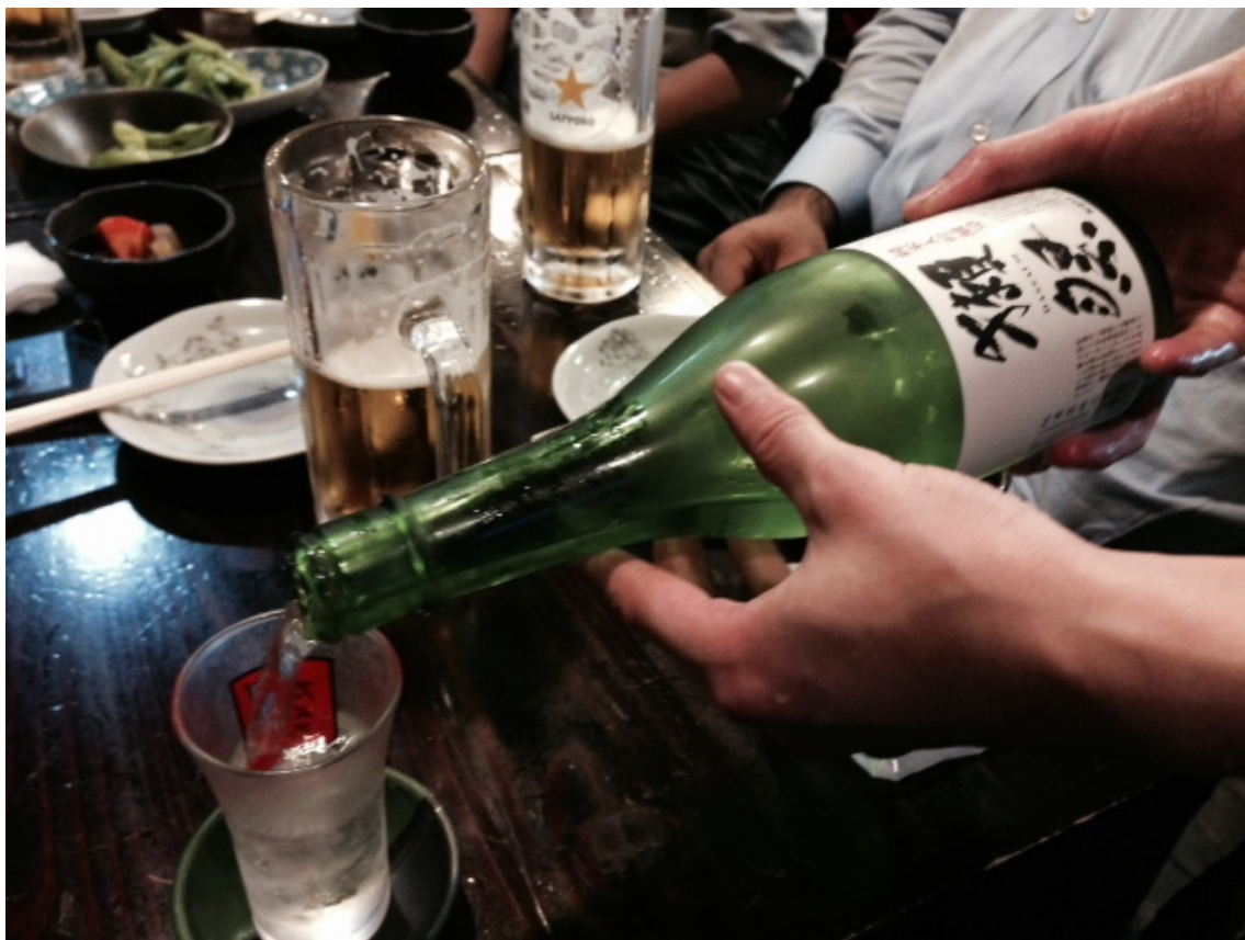
【打合せ終了後、入手困難な日本酒を酌み交わす様子】