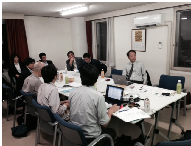
【事前打合せの様子】