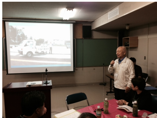
【実践に踏み切った委員の方の活動報告】

1回目の検討会は検討委員の皆様は6名で始まった当検討会も、現在は43名の大所帯となりました。