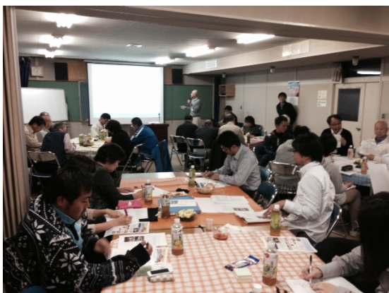
【前回迄の振り返りを説明する伊槻座長】