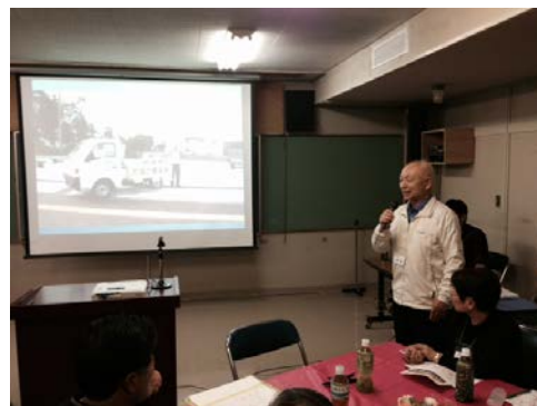
【みちの駅で新じゃがを販売した報告】