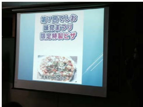
【地元のイベントでピザを販売した報告】