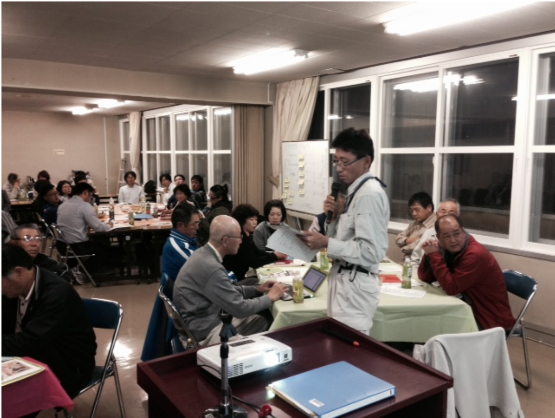
【各チームで話し合った事を発表】