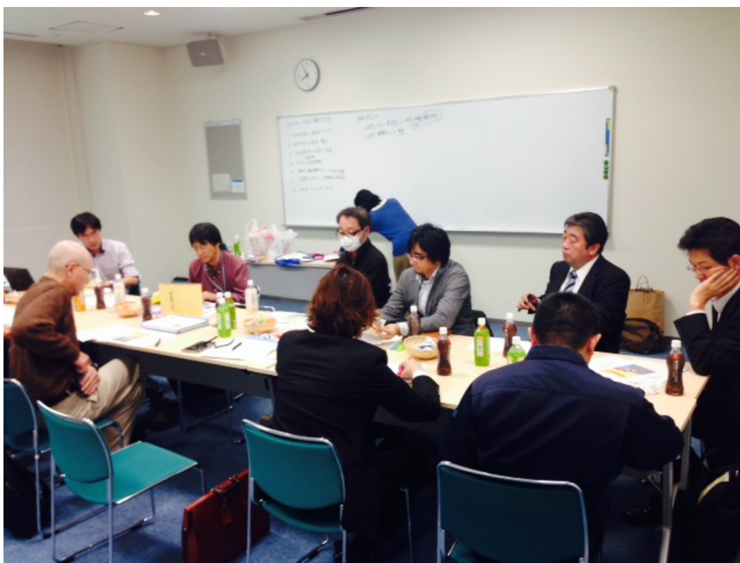
【事前打合せの様子】