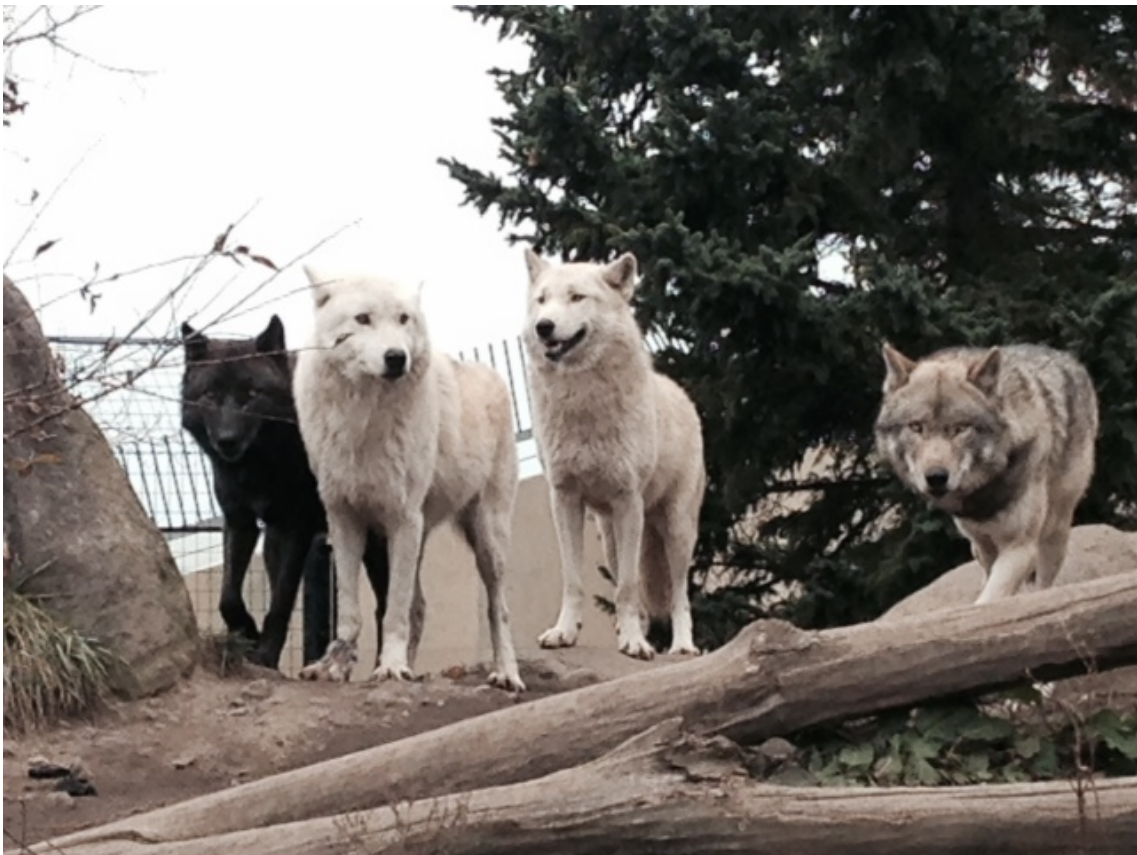
【歴史チームが展示方法の勉強をしに旭山動物園を訪問した際に撮影したオオカミたち】