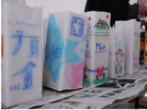
制作したコロコロキャンドル