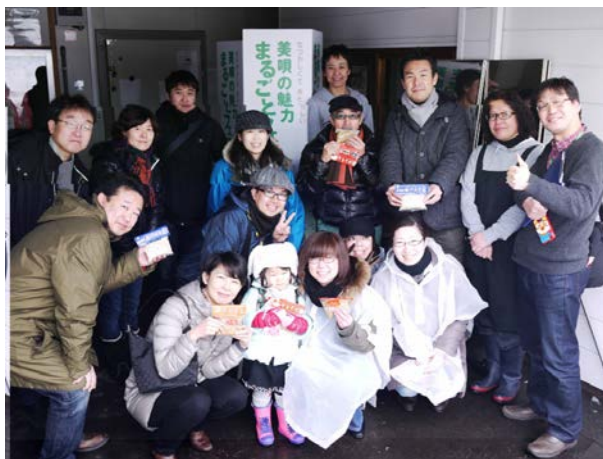
袋焼きそば 工場見学 in 角屋