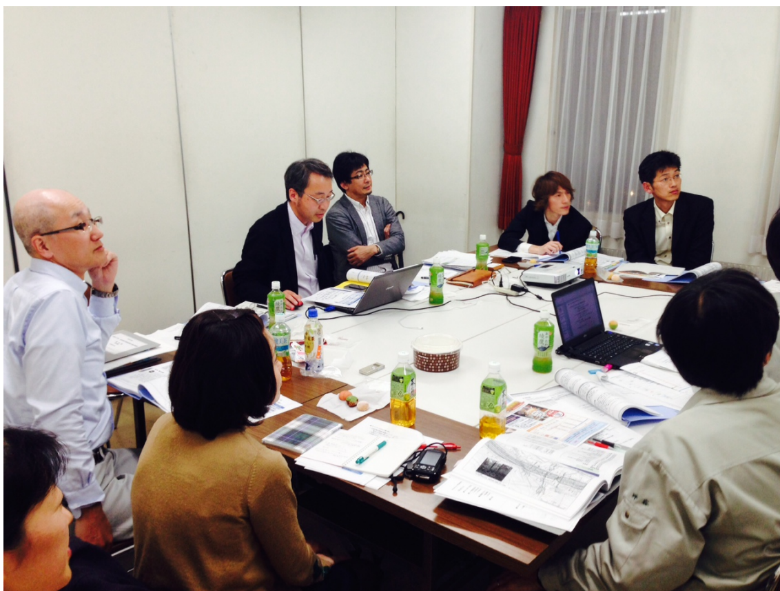
【白熱した打合せが進む様子】

当該事業を発注した方2名、受注者した会社の方4名、そして天塩町役場1名の計11名で開始。