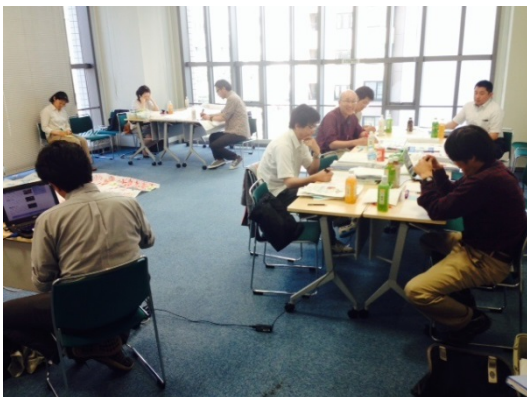
【各自でコンセプトを考える】

コンセプトが決まれば、それを実現するためのそれぞれの分野のビジョンは、各チームごとに考えることで一致。とはいえ、これだけ集まったキーワードはどれもが捨てがたい大切なものばかり。ここはやはり集約が得意な方や語彙が豊富な方にはかないません。