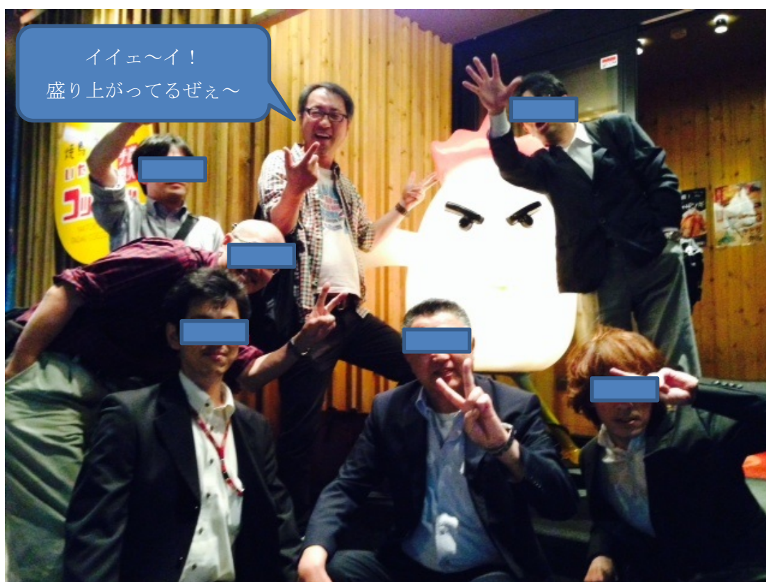
【月曜日というのにかなり出来上がってしまった懇親会】

その他諸々話し合いましたが、何せ今回は長丁場。ここらでお許し下さい。そしてお待ちかねの懇親会。